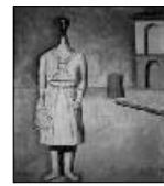
<사진 3> 카를로 카라, 1919. “The Girl from the West” Masterpieces of 20th Century