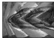
<사진 2> 루이지 루솔로, 1912. “자동차의 역동성” 20세기 미술운동총서