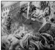
<사진 1> 움베르토 보치오니, 1911. “동시적 시각” 20세기미술운동총서

당시의 사회가 요구하는 산업화와 도시화를 역동적으로 표현하고 있다. 미래주의자들에게서 찬양 받고 숭상되던 것은 기계미였다. 따라서 이들은 도시 대중과 기계문명을 상징하는 자동차나, 열차를 작품에 등장시켰으며, 이들 작품의 주제는 속도와 관련되어 나타난다. <사진 2>는 자동차에서 느껴지는 역동성과 속도미를 표현하고 있다. 미래주의자들은 예술전반에 걸친 미래주의 운동의 영역을 넓히고자 회화의 역동적 표현방법을 복식에 옮겨놓으며, 복식 선언문을 통해 파괴적인 색채와 패턴으로 새로운 스타일을 제시하였다. 1914년에 발라가 표명한 남성복식 선언문과 미래주의 복장에 대한 11가지 특징의 내용은 공격성, 민첩성, 역동성, 단순성과 편안함, 위생성, 활기, 발광성, 강한 의지성, 비대칭성, 단명성, 가변성 6) 으로 요약할 수 있다. 미래주의 패션은 1914년과 1933년 사이에 발라를 주축으로 미래주의 화가들에 의해 남성복, 여성복, 심지어 모자, 크라바트(cravate)에 대한 선언문이 지속적으로 작성되어, 유럽의 커다란 도시의 거리를 무대로 복식 전반에 걸친 디자인을 제작하기에 이른다. 그러나, 실제로 문헌에 나타난 복식은 선언문의 미래 패션과는 다르게 표현되었다. 이는 미래주의 작가인 카를로 카라의 작품인 <사진 3>을 통해 알 수 있다. 그들의 복식은 단지 주름진 스커트로 움직임 표현하고 있으며, 사선을 사용함으로써 비대칭적인 형을 보여주고 있다. 미래주의자들의 패션 성향은 산업적이고 기계적인 이미지를 추상화시켜 기하학적 패턴과 바퀴, 빌딩, 기계 등을 상징적으로 제시하기도 하였다. 기하학적 패턴은 수직, 수평 또는 사선이나 지그재그 선으로 형태를 이루어 딱딱하고 날카로운 느낌은 주기도 하며, 기계적인 형상을 내포한 바퀴는 현대 사회의 리듬을 나타내는 기계작동의 핵심적인 요소로 그 선화하는 리듬과 동시성을 지니고 시각적으로 큰 효과 7) 를 준다. 오늘날 미래주의자들의 복식은 강렬한 색채와 비대칭적이고 기하학적인 패턴 등 현대 패션에 지대한 영향을 주고 있으며 미래에도 지속적으로 나타날 것이다.