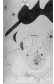
<그림 11> Miro 1939 밤의 새