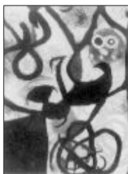
<그림 7> Miro 1968 한밤중의 여인과 새

[태양앞에 사람, Personnage devant le Soleil , 1968] <그림 8>에서는 마치 액션 페인팅을 주는 듯한 느낌을 주면서 별처럼 반짝이는 듯하다. 직접적인 손의 움직임이 그대로 대담한 표현으로 나타난다. 캘리그래픽한 굵은 선은 힘차게 빠른 속도로 그려져 있고 그 정과 동의 대비가 이 화면 깊숙히 공간과 리듬을 안겨주고 있다.여기서 미로는 드로잉적인 요소에 심취하고 있음을 엿볼 수 있다.