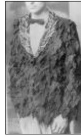
<그림 6> Adelle Lutz 作 1987