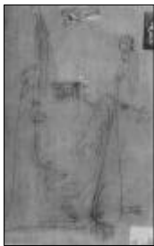
<그림 3> Miro[drawing collage] 1933