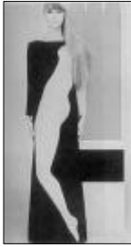
<그림 5> Yves Saint Laurent 作 1966-67

완벽하게 나타내고 있다. 이외에도 소재의 해방으로부터 나타난 금속을 이용한 스티로폴로 인체를 재구성하는 복식으로 초현실주의의 기이하고 흥미로운 표현들이 무한히 존재하는 것을 암시해 준다.