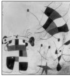
&lt;작품 I의 모티브&gt;