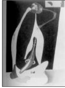
<그림 10> Miro 1938 앉아 있는 여인