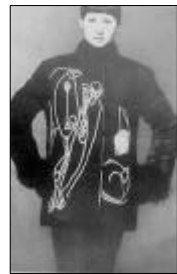
<그림 4> 이신우 作1993