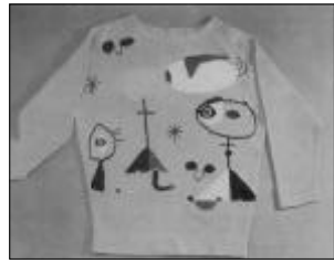
<그림 2> Laura Ponte 1987