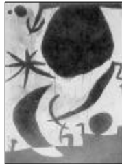
&lt;작품 III의 모티브&gt;