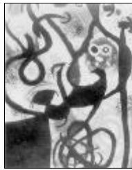
&lt;작품 V의 모티브&gt;