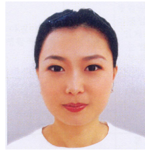
<그림 4> 메이크업 후 (사각형 얼굴형태)