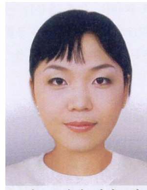
<그림 10> 메이크업 후 (역삼각형 얼굴형태)