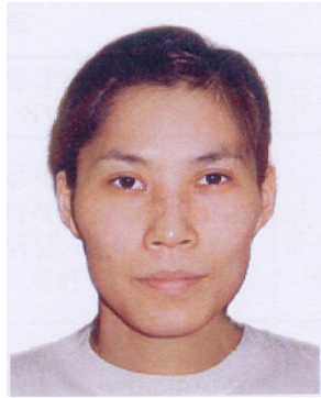
<그림 7> 메이크업 전 (마름모형 얼굴형태)