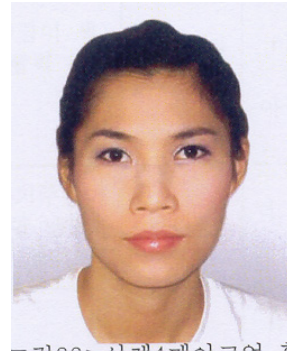
<그림 8> 메이크업 후 (마름모형 얼굴형태)