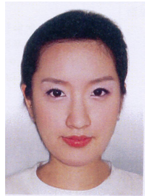
<그림 6> 메이크업 후 (긴 얼굴형태)