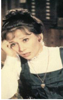
<사진 5> 제 2막

면으로 이 장면에서 패션을 통한 신분상승의 시험은 가능성을 보여준다. 여주인공의 의상은 시대의 고증을 기본으로 하였고 조연들의 의상과 색채, 소재를 차별화 시켜 화려함과 부유한 사회계층에 속해 있음을 연출하였다. <사진 6>