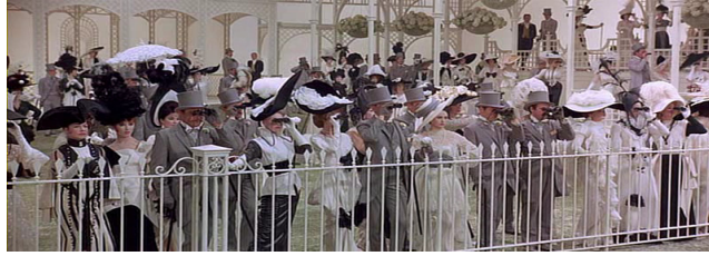
<사진 10> 제 3막