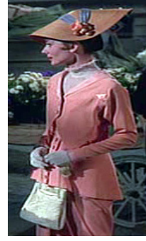
<사진 8> 제 4막

황태자가 일라이자에게 첫 춤을 요청하여 두 사람이 무도회의 주인공이 되는 장면으로 영화에 함축된 신데렐라적 동화 요소의 정점에 해당한다. 몇 마디 안 되는 대화에서 그녀는 완벽한 영어를 구사하는 귀부인으로 인정받기에 이르며, 영화 속의 조연들, 소품들과 함께 그날의 주인공임을 보여준다. <사진 7>