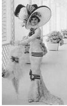
<사진 6> 제 3막