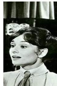
<사진 4> 제 2막