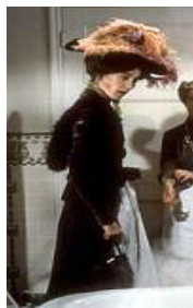
<사진 2> 제 2막