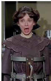
<사진 3> 제 2막