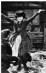
<사진 1> 제 1막

일라이자가 히긴스교수의 집에 방문한 장면으로 일라이자는 자신이 할 수 있는 한 최대한으로 멋을 내었으나 결국은 하녀들에 의해 강제로 욕탕에 끌려가는 장면으로 계절과 컬러에 대한 격식에 어긋난 연출로 그녀의 취향과 감각적인 수준을 촌스럽고도 천하다는 느낌을 갖게 연출되었다. <사진 2>, 일라이자의 아버지가 딸을 찾으러 히긴스교수의 집에 방문한 장면과 일라이자의 영어 발음이 교정되어 기뻐하는 장면으로 수련생의 신분을 상징하며 교양훈련을 받은 이미지를 표현하고 있다. <사진 3~5>