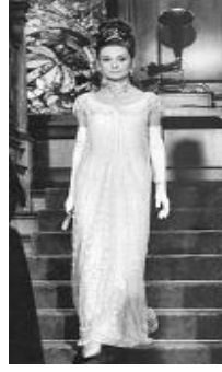
<사진 7> 무도회