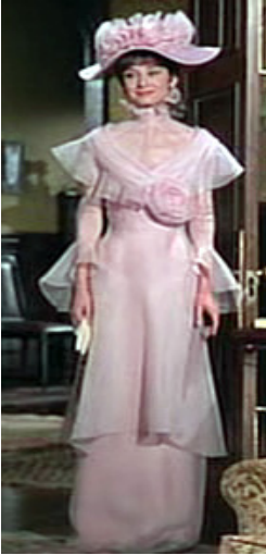
<사진 9> 제 5막