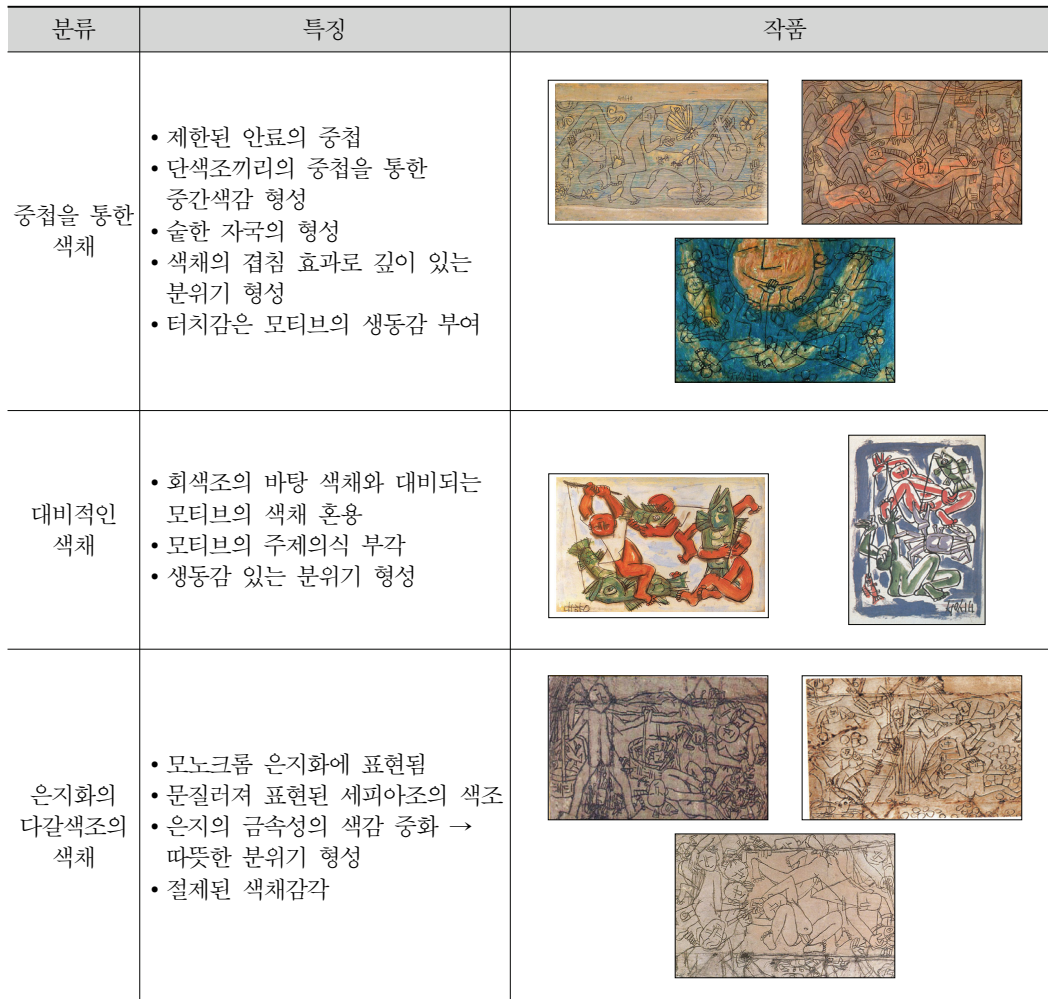
<표 3> 군동화의 색채분석