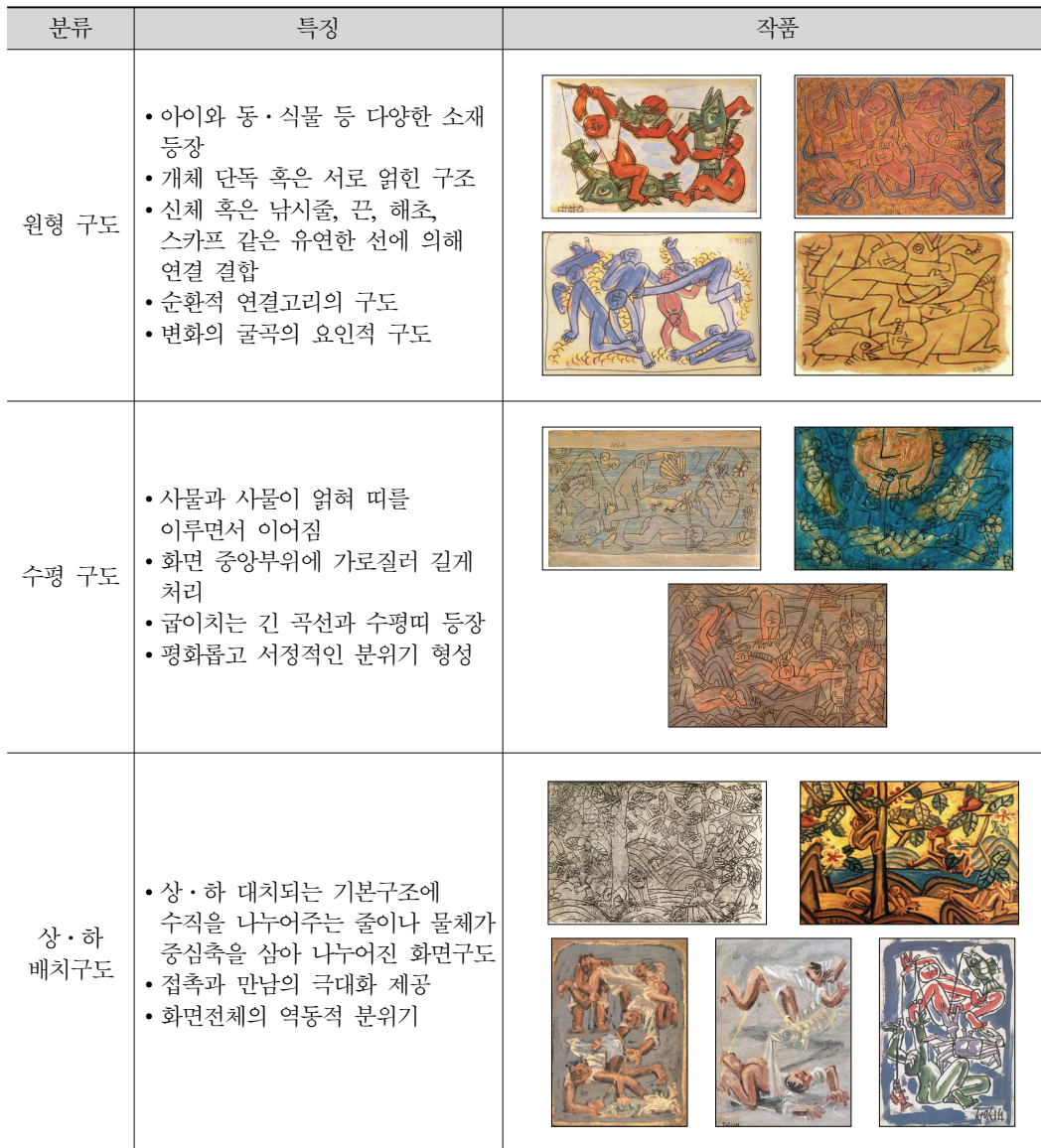
<표 1> 군동화의 구도분석

이상의 군동화 특징 가운데 구도와 선, 그리고 색채에 대한 조형적 특징을 각각 <표 1>, <표 2>