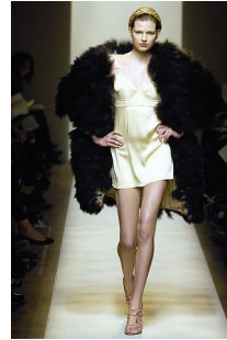
<그림 15> Bottega Veneta, '07 F/W Collection