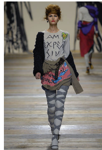
<그림 11> Vivienne Westwood, '06 F/W Collection