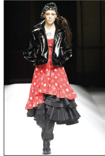
<그림 14> Yohji Yamamoto, '07 F/W Collection