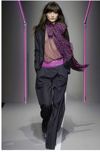
<그림 7> DKNY, '07 F/W Collection