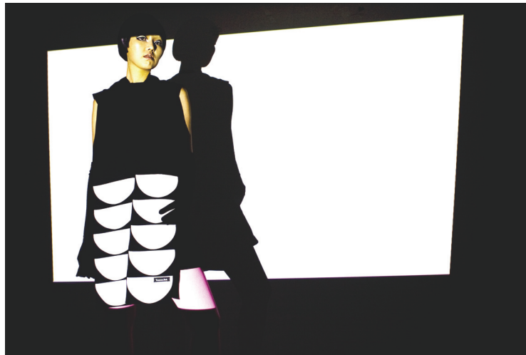
<그림 30> 작품 V