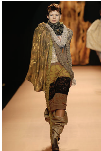
<그림 10> Vivienne Westwood, '07 F/W Collection

여러 개의 옷을 겹쳐 입거나 층을 내어 입는 방법으로 ‘겹치다, 끼입다’를 의미하며 다양한 아이템을 복합적으로 조화시키는 연출방법이다. 이때 다양한 아이템을 복합시켜 자유롭게 개성 있게 연출하여 기존의 이미지를 완전히 무시하는 스타일링도 가능하므로 개인이 자유롭게 기존의 의상이 가지고 있는 이미지를 복합적으로 스타일링 함으로써 또 다른 룩을 창조시키며 더 큰 시각적인 아름다움으로 나타낼 수 있는 이중적인 분위기로 신선함을 연출하는 스타일링이다. <그림 10, 11, 12>