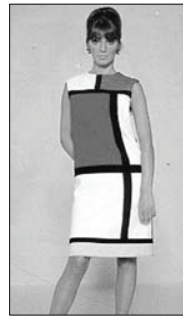
<그림 3> 입 생 로랑 작품