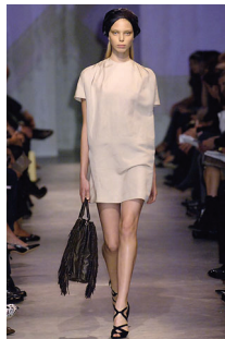
<그림 19> Prada, '07 S/S Collection