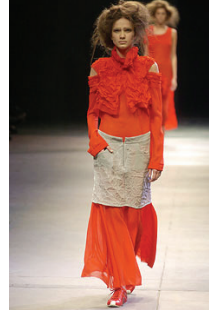
<그림 9> Yohji Yamamoto, '05 S/S Collection