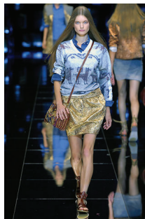
<그림 5> D&G, '08 S/S Collection (출처; http://www.style.com )