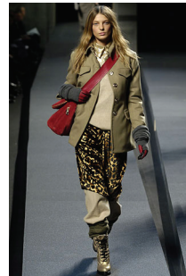
<그림 12> Marc Jacobs, '06 F/W Collection