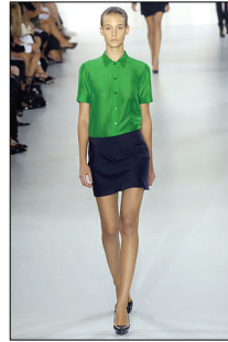
<그림 18> Jil Sander, '07 S/S Collection (출처; http://www.style.com )