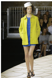
<그림 4> 3.1 Phillip Lim, '08 S/S Collection

피스(piece)는 ‘부분’, ‘단편’, ‘조각’ 등을 의미하는 단어로 원피스, 재킷과 같은 단품을 지칭하며 하나하나 떨어져 있는 의상을 멋있고 조화롭게 연출하는 방법을 말한다. 이는 패션 스타일링의 가장 기본이 되는 기법으로, 가장 대중적인 스타일링 연출법으로 개인의 감각을 이용하여 개성 있고 멋있는 스타일로 만들어 낼 수 있는 손쉬운 방법 중 하나이다. <그림 4, 5, 6>