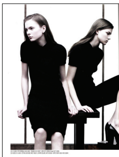
<그림 21> VOGUE KOREA, '07 09월호

<그림 25>는 VOGUE ITALIA, 2007년 8월호 작품으로 미니멀리즘 패션의 미래지향성을 나