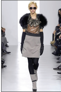
<그림 13> Marni, '07 F/W Collection

격적으로 변신시키는 방법으로 성질이 다른 것을 하나로 융합시켜 부조화를 통해 기묘함과 의외성을 부각시키는 연출방법이다. <그림 13, 14, 15>