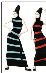
<그림 22> ELLE KOREA, '07 09월호