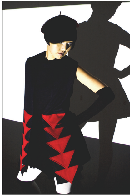
<그림 29> 작품 IV