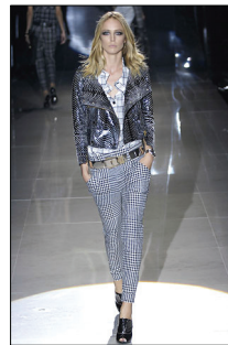
<그림 6> GUCCI, '08 S/S Collection