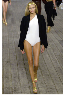
<그림 17> Hermes, '07 S/S Collection