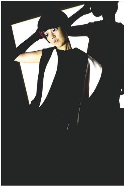
<그림 28> 작품 III