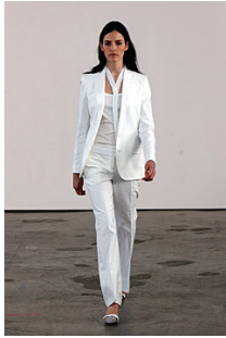
<그림 16> Helmut Lang, '02 S/S Collection

Calvin Klein, 2007, F/W Collection <그림 20> 작품으로 바디라인의 실루엣을 그대로 살려주는 블랙 튜브톱 원피스에 브라운 스타킹과 슈즈를 매치하여 모던하면서도 시크한 이미지를 나타내고 있으며 브라운 톤 눈썹의 누드 메이크업과 같은 컬러로 염색한 헤어스타일이 상, 하로 통일감을 이루며 전체적으로 세련된 이미지를 부각시켜주는 스타일링으로 연출하였다.