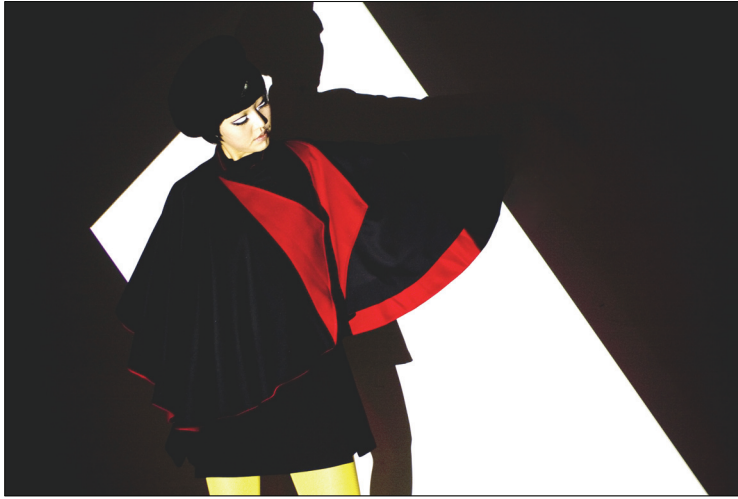
<그림 26> 작품 I