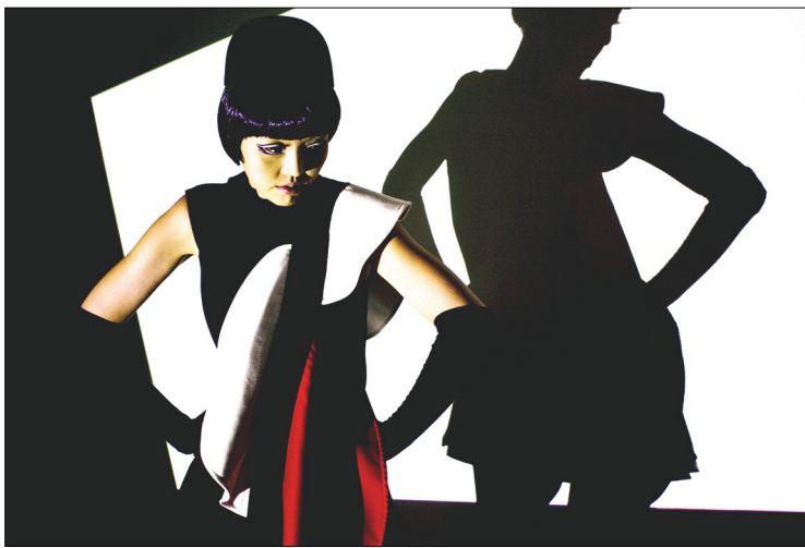
<그림 27> 작품 II