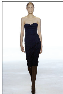
<그림 20> Calvin Klein, '07 F/W Collection