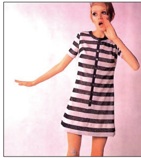
<그림 2> 트위기