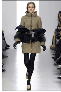
<그림 8> Marni, '07 F/W Collection