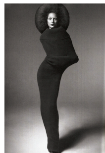
<그림 23> VOGUE ITALIA, '07 10월호