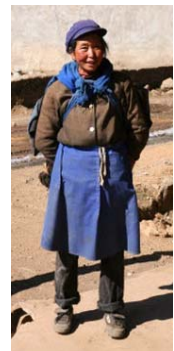
<그림 15> 웨이하이 산악지역의 나시족 여인 운남성 웨이하이 (출처: 2009년 1월 11일 촬영)