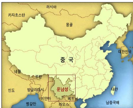
<그림 1> 운남성의 지리적 위치

중국에서 가장 많은 소수민족이 살고 있는 운남성에는 중국 내의 55개 소수민족 중 51개 소수민족이 거주하고 있으며, 그 중 인구 5천명 이상인 민족은 약 25개이다. 이 중 바이족(白族)과 다이족(傣族) 등 15개 민족은 운남성에만 있는 민족이다. 운남성 전체 인구 중 소수민족의 비율은 약 38%이며 이족(彝族), 바이족(白族), 하니족(哈尼族), 좡족(壯族), 티베트족(藏族), 다이족(傣族), 먀오족(苗族), 리수족(傈僳族), 후이족(回族), 라후족(拉祜族), 나시족(納西族) 와족(佧族), 아창족(阿昌族), 누족(怒族), 더앙족(德昂族), 지뉘족(基諾族), 수이족(水族), 두룽족(獨龍族) 등의 소수민족이 있다.