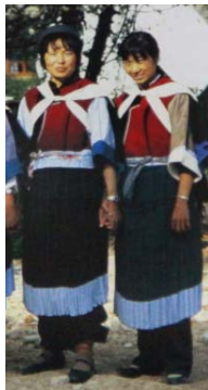
<그림 4> 나시족의 민속복식