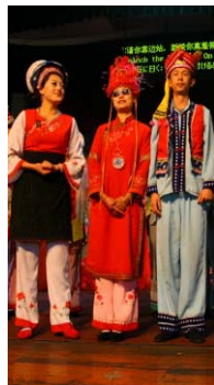
<그림 12> 백족자치구의 백족 전통 공연모습, 운남성 저우청