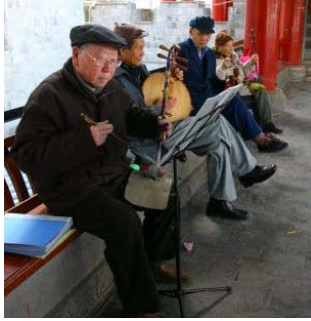
<그림 16> 전통악기 연주하는 노인들, 운남성 쿤밍 (촬영: 2009년 1월 6일 촬영)