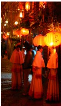
<그림 11> 관광객을 위한 식당가의 전통복치림의 종업원들, 운남성 리장

로 이들은 면접 시에 전통복식을 착용하지 않고 있었으며, 이들의 면접이 진행된 지역인 다리, 리장, 루난, 징훙, 멩라 등에서는 전통복식을 착용한 사람을 거리나 재래시장 등에서 찾아보기 쉽지 않았다. 면접자 중 한명은 본인이 소유한 전통복식이 한 벌도 없다고 답하였고, 면담자들이 각 민족의 전통복식을 직접 착용하는 경우 역시 매우 제한적이어서 1년에 각각 0-2회로 응답하였는데, 주로 자신이 속한 민족의 전통 축제일에 착용한다. 징훙에 거주하는 응답자만이 축제일 뿐 아니라 명절이나 잔치가 있을 때마다 착용한다고 응답하였다. 이와 같이 전통복식의 매우 제한적인 착용은 면접대상자 5인의 경우에 국한된 것이 아니며, 또래 친구들이나 같은 민족 여성들이 대부분 비슷한 상황이라고 모두가 답하였다. 실제로 전통복식을 일상적으로 착용하고 있는 소수민족 여성들은 누가 있느냐는 질문에는 전통문화에 익숙한 일부의 노년층과 외부 관광객을 상대로 하는 상점이나 식당의 종업원들이라는 답이 가장 많거나 먼저 나왔으며, 변화한 도시지역과 멀리 떨어진 외진 지역이나 산악지역 거주민들과 민속촌이나 전통 공연장 등의 공연자 및 종사자들이라는 응답도 나왔다. 모든 응답자는 젊은 세대 중 일상적으로 전통복식을 착용하는 사례는 없다고 한결같이 대답하였다.