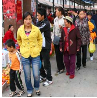
<그림 17> 다이족 마을의 재래시장, 운남성 간란바