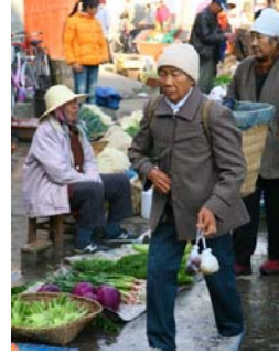
<그림 18> 따리고성의 재래시장, 운남성 따리

본인을 포함하여 소수민족 사람들이 전통복식을 착용하지 않는 이유에 대한 질문에는 다양한 답이 나왔는데 첫째, TV와 인터넷 등을 통한 외래문화의 활발한 유입, 둘째, 서구와 한국, 일본 등의 선진문화 또는 복경 등을 비롯한 대도시 사람들에 대한 동경 및 동조현상, 셋째, 소수민족 전통복식의 불편함과 낡은 것으로 간주하는 풍조, 비싼 가