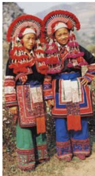
<그림 2> 이족의 민속복과 장신구

바이족은 운남성 따리의 바이족자치구를 비롯하여, 운남성 중부와 서부에 고루 분포하고 있다. 백색을 선호하는 바이족은 복식에서도 백색을 많이 착용하고 있다. 남자들은 주로 흰색의 조끼와 머리띠를 하며 곁에 짙은 색 조끼를 입는다. 여자들은 일반적으로 위에 흰색이나 옅은 색의 달라붙는 소매의 옷을 입는데, 이는 짙은 색 둥근 목깃의 조끼와 머리에 두르는 여러 색으로 수놓아진 머리장식과 선명한 색채 대비를 이룬다. 19) 오랜 역사와 바이족의 다양한 전통 문화유산, 따리 지역의