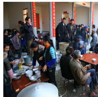
<그림 10> 신축가옥의 안전과 복을 기원하는 바이족 잔치, 운남성 저우청