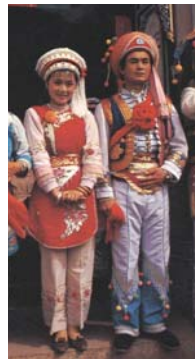
<그림 6> 바이족의 전통혼례복 (출처: 『中華民族服飾文化』, 1992, p.158)