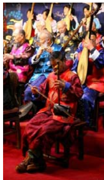
<그림 14> 전통 도교음악 공연장의 악사들, 운남성 리장 (출처: 2009년 1월 9일 촬영)