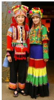
<그림 13> 곤명 전통문화 공연장 입구의 안내원들, 운남성 곤명