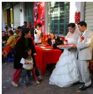
<그림 9> 다이족 신랑 신부와 하객들. 운남성 명라