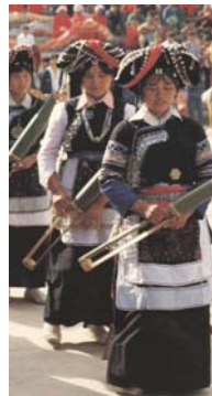
<그림 5> 하니족 여성의 명절복식