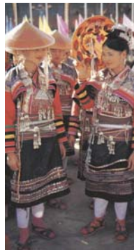
<그림 3> 다이족의 민속복과 장신구