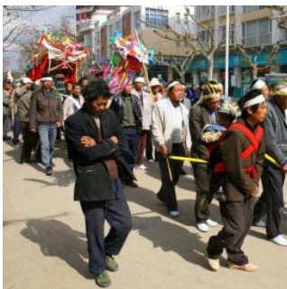
<그림 8> 꽃상여와 장례행렬. 운남성 루난 (출처: 2009년 1월 7일 촬영)

중국 내에서 소수민족이 가장 많이 살고 있는 운남성은 각종 문헌이나 다양한 미디어를 통하여 여러 소수민족들이 각기 다른 화려한 전통 민속복식을 착용하고 있는 것으로 알려져 왔다. 그러나 실제로 전통복식을 일상적으로 착용하는 사람은 찾아보기 쉽지 않을 뿐만 아니라, 심지어는 상례와 혼례 등의 통과 의례에서조차도 전통복식이 아닌 서구화된 복식을 착용하고 있었다. 연구자가 조사활동을 하는 기간 중에 관찰된 행사 중에는 상여행렬<그림 8>과 세 차례의 민가 내 결혼식<그림 9>, 신축 중인 가옥의 안전과 복을 기원하는 전통방식의 마을잔치<그림 10> 등이 있었으나 이러한 의례에서조차도 전통복식을 착용한 사람은 찾아보기 쉽지 않았다. 이것은 운남성 내 여