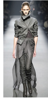
<그림 10> 2008 F/W Haider Ackerman