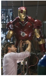
<그림 4> Iron Man, 2008년