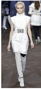
<그림 11> 2008 F/W Fendi