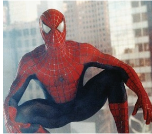
<그림 2> Spider-Man, 2002년