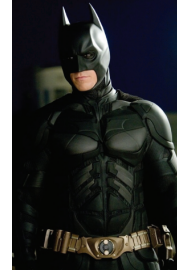
<그림 3> The Dark Knight, 2008년

력을 상징하는 빨간색, 그리고 부와 권위를 상징하는 노란색의 색채 조합은 영웅의 모습을 강렬하게 강조한다. 슈퍼맨, 스파이더맨에 사용된 빨강과 파랑은 평화와 자유를 상징하는 미국 성조기의 색으로 세계의 경찰을 자처하는 미국의 제국주의적 입장을 암시하며, 아이언맨에 사용된 빨강과 노랑은 스스로 쌓아올린 부를 통하여 슈퍼히어로가 된 아이언맨의 입장을 나타내는 조합으로 자본주의 사회에서 대중이 부러워하는 승배의 조건인 자본의 힘을 상징적으로 나타낸다고 볼 수 있다. 반면, 전체적으로 검정색을 사용한 배트맨의 의상은 신비로움과 어두운 면을 부각하고, 범죄자들에게 공포심을 주기위해 의도적으로 사용된 것이다. 19) 이 밖에 신비함을 유지함과 동시에 캐릭터의 정체성을 강조하는 마스크, 신체를 확장하고 움직임의 효과를 극적으로 표현함으로써 위압적인 힘을 강조하는 망토, 신체를 보호하는 장갑과 부츠, 성적인 의미를 내포하는 체찍과 하이힐 등을 착용함으로써 슈퍼히어로 특유의 복장이 완성된다.