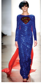
<그림 13> 2011 F/W Jeremy Scott