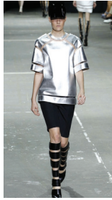
<그림 12> 2013 S/S Alexander Wang

강조한 스타일과, 현대적 의미의 ‘능력’을 의미하는 기계적 기능성을 표현한 스타일 나타나며, 내적으로는 기능성과 하이테크성을 표현하는 것으로 볼 수 있다.