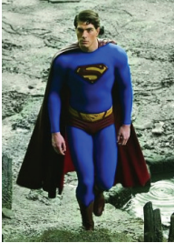
<그림 1> Superman Returns, 2006년