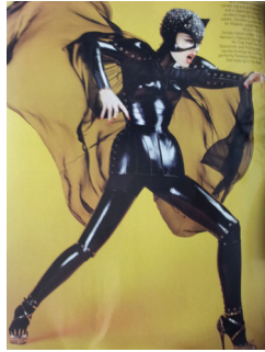
<그림 8> 2007 S/S Dolce & Gabbana