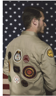
<그림 12> 10.Deep Holiday 2010