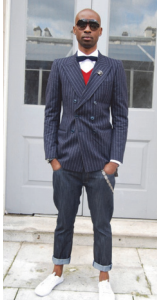
<그림 3> Tommy Hilfiger S/S 2011