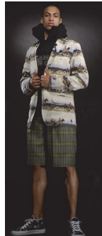
<그림 17> Billionaire Boys Club F/W 2009