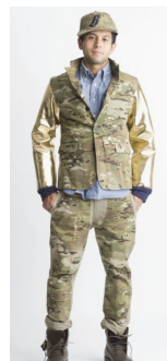
<그림 18> Bee S/S 2013