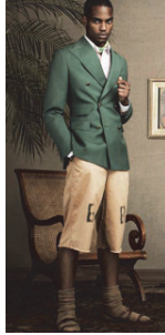
<그림 4> Benjamin Bixby S/S 2008