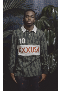
<그림 13> 10.Deep Spring 2013

의 전형적인 착장 구성을 보이는 <그림 10>은 손목이 드러나는 짧은 소매와 과거 귀족 상징적 계급의 문양인 로코코 패턴을 사용한 재킷, 버튼다운 셔츠와 타이, 마드라스 체크 패턴을 적용한 발목이 드러나는 짧은 길이의 팬츠를 활용하여 트레이디셔널한 아이템들을 부각시켰다. 그러나 팬츠를 엉덩이 중간 아래까지 내려 입는 힙합 패션의 새기 팬츠 형식을 차용한 착장 방식을 통하여 프레피 룩 아이템들에 대한 저항성을 표출하였다. 이는 과도한 거부감을 주는 일탈적이고 과격한 저항의 의미보다는 저항을 통한 개성을 표출하고, 다른 아이템들 간의 매치를 통해 프리프합 패션만의 새로운 이미지의 확대를 이룬다.