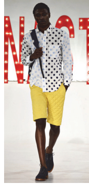
<그림 22> Mark McNairy S/S 2013