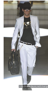
<그림 8> DSQUARED2 S/S 2009

단 조각들을 올 폴림이 있는 패치워크 형식으로 재조합한 로 에지(raw edge) 페이브릭 수트를 디자인하였다. 보수적이고 단정한 이미지의 프레피 룩 체크 패턴을 정리된 마무리가 아닌 로 에지로 표현하는 것은 힙합 패션에서의 저항적이고 일탈적 성격을 반영한 것이다. 그러나 이러한 소재 표현은 거칠고 저항적인 이미지보다는 자연스럽고 개성 있는 표현으로 의미된다. 또한 브라운 컬러의 카무플라주 패턴의 사파리 햇(safari hat)을 착용하여 프레피 룩의 대표 패턴과 힙합 패션의 대표 패턴을 공존시켜 정통성의 혼성을 보여주고 있으나, 각각의 의미는 매우 약하게 전달된다<그림 6>. 프레피 룩 아이템과 힙합 패션의 과시적 성향의 결합은 소재 사용을 통해서 부각된다. 마크 맥네어리는 2014년 F/W 컬렉션에서 네이비 핀 스트라이프 소재의 수트에 카무플라주 패턴의 볼륨감 있는 가짜(fake) 모피 코트를 매치하였다<그림 7>. 모피는 정통 힙합 패션에서 형태적, 내적으로 과시적 성향을 나타내는 대표적 소재이며, 힙합의 정신을 잃지 않고 비주류로 남고자하는 의지를 표현한다. 또한 가짜 퍼를 사용하는 것은 고급 지향의 상위 문화 패션에 대한 저항이며 프리프합 패션의 캐주얼함을 강조하는 것이다. 힙합 패션에서 위압적 혹은 과시적 이미지로 표현되었던 모피는 프리프