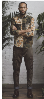
<그림 15> 10.Deep Spring 2013