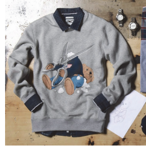
<그림 2> Marc Ecko cut & sew bear sweatshirt, 2013

표현 언어로 ‘하이브리드’, ‘퓨전’, ‘크로스오버’, ‘컨버전스’, ‘혼합’ 등이 사용되었다.