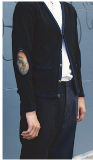
<그림 11> Antonio Azzuolo S/S 2014