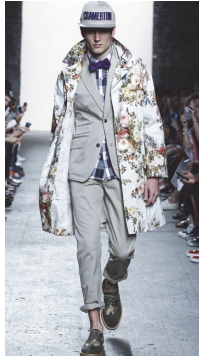
<그림 20> Mark McNairy S/S 2014