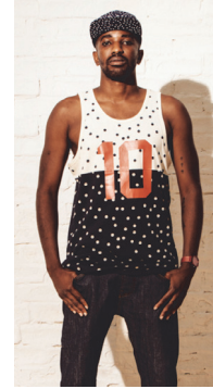
<그림 23> 10.Deep Spring 2013

는 것이다. 이는 현대 패션에서 장르의 융합을 통해 발생하는 감성 지향으로 나타나며 심각성을 가지지 않는다. 유희성은 크게 착장방식, 형태의 구성 방식, 문양, 소재, 컬러 등을 통하여 나타나지만 전반적으로 모든 것들이 유기적 연관성을 가지고 표현되며, 장르 간 융합 현상을 통해 비주류의 확장을 일으키고 의외적 표현으로부터의 유희적 감성을 발생시킨다. 이러한 유희성은 감성 추구를 통해 즐거움의 요소를 발견하고 창의적인 발상의 무한한 영역을 제공함에 따라 현대 패션에서 중요한 의미를 가진다.