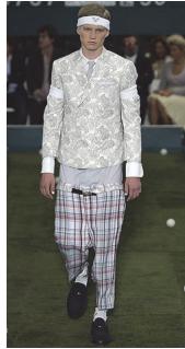
<그림 10> Thom Browne S/S 2009