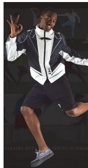
<그림 16> Billionaire Boys Club S/S 2008