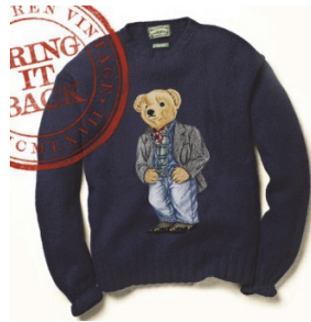
<그림 1> Ralph Lauren bear sweater, 2013