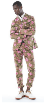
<그림 21> Mark Mc Nairy S/S 2014