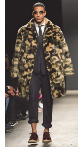
<그림 7> Mark McNairy F/W 2014