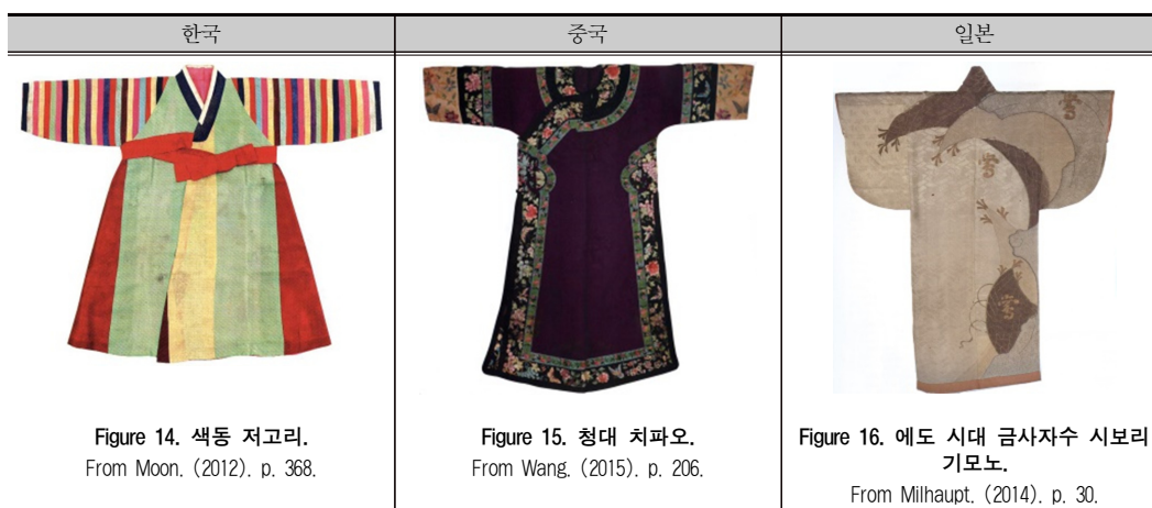
Table 5. 한·중·일 전통 복식의 색 비교.

식화, 양식화, 추상화하였다(Jeon, 2003). 우리나라 문양의 가장 큰 특징은 상징성이다(Lee & Choi, 2009). 문양의 회화적 표현보다는 단순화되거나 체계화된 문양이 반복적으로 되풀이되는 형태를 보여준다(Kim, 2006). 중국은 사실적인 형태와 세밀한 디테일이 특징이며 좌우대칭과 일정한 형식에 따른 정형화된 배치를 한다(Kim, 2006). 모티프의 형태를 간단하게 정리하기보다 음양이나 색의 농도를 조절하여 사실에 가깝도록 표현하려 한 점과 금색을 표현할 때 금박보다 두꺼운 금사로 수를 놓은 것은 모티프의 입체화를 표현하려 한 것으로 보인다(Ryu, 2010). 문양에 크기는 삼국 중에 중국이 가장 크다. 일본은 다양한 문양의 사용이 특징으로 극히 사실적인 표현과 함께 양식화된 형태 또는 기하학적인 형태의 문양을 사용하였다. 기모노에 사용된 문양은 생활 주변을 소재로 많이 사용하였고, 자연풍경을 그대로 회화처럼 사용하거나(Jeon, 2003), 원래 형태의 특성을 살려 단순화하였다.