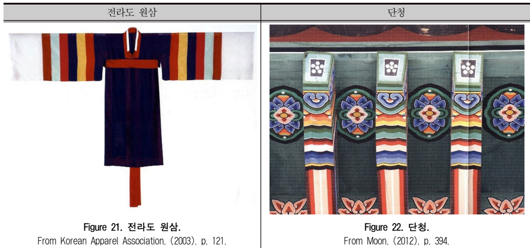
Table 9. 원삼과 단청.

차분하지만 금색으로 강조하는 경우가 많다. 기모노에도 스리하쿠(すりはく)와 같은 기법으로 금색을 표현하였다. 우리나라는 중국의 영향으로 금색을 자유롭게 사용할 수 없었지만 다양한 색상을 적당히 배열하여 경쾌함을 주었다. 보색의 충돌을 피하기 위해 채도와 밝기의 차이가 있는 색들을 사이에 배치한 단청같이(Ji, 2015) 우리나라는 실제로 빛이 나는 금색을 사용하지 않더라도 적당한 색조함으로 청량감을 주었다.