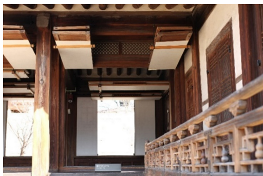
Figure 2. 완전히 열리는 들어열개문. (August 10, 2016)

우리나라 주거 건축은 북방의 온돌과 남방의 마루가 결합된 방식이다. 13, 14세기에 널리 확산된 온돌은 고려후기에 와서 온돌이 실내 전면에 깔리게 되면서 아궁이가 건물 밖으로 나가 부엌과