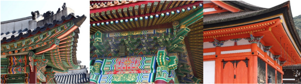
Figure 8. 단청 비교(왼쪽부터 한국, 중국, 일본의 단청). (March 12, 2017)