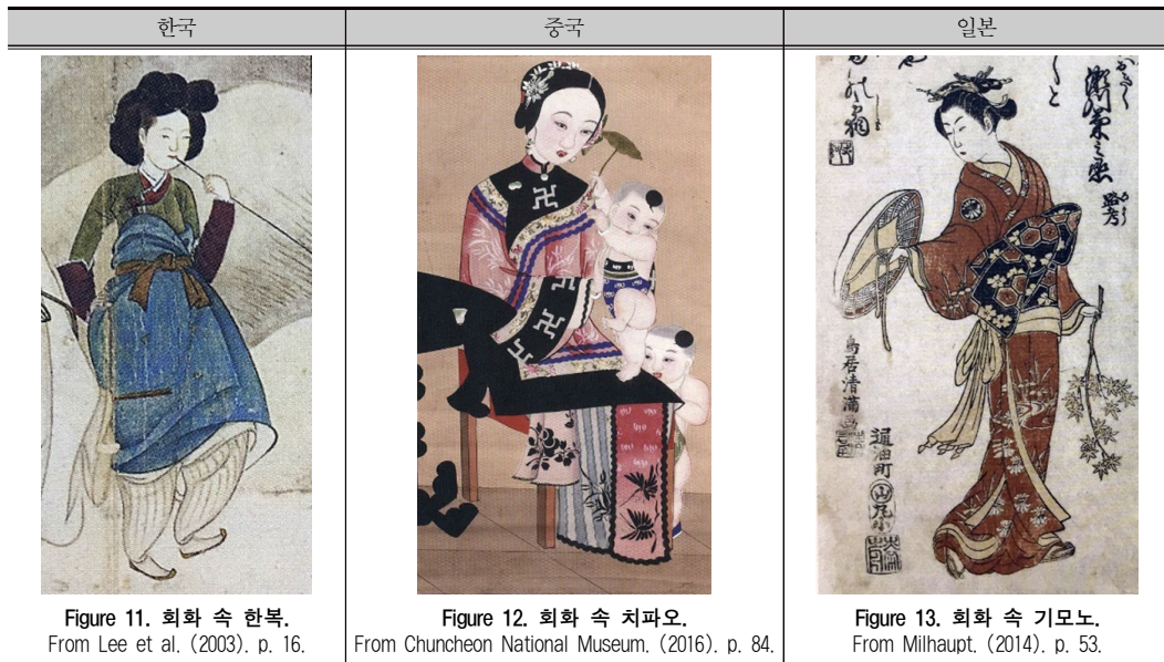
Table 4. 회화에 나타난 한·중·일 전통 복식의 형태 비교.

리나라는 담백하고 은근한 품위를 지닌 색을 선호하고, 중국은 꾸밈이 많고 장식적인 무늬에 농도 짙은 색채를 구사하며, 일본은 기교와 장식성을 나타낸 산뜻하고 정갈한 색채를 쓴다(Kwon, 2006). 전반적으로 색상의 채도는 중국, 한국, 일본 순으로 높으며, 명도는 한국, 중국, 일본 순으로 높다. 일본은 중명도, 중채도로 회색 톤을 띤 순색계통의 사용이 많다.