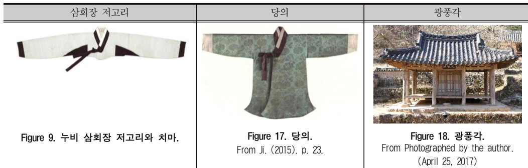
Table 7. 한국 건축의 지붕선과 저고리 배래선과 도련선.

제작의 효율성보다 흐르는 대로 자연스러운 형태를 만들어 자연과 일체감을 느끼려는 미의식은 한옥과 한복의 곡선에서 공통으로 보여준다. 한복의 치마는 폭을 붙이고 주름을 잡아 말기에 고정시킨 반 완성된 형태로 착용자의 상황과 취향에 따라 유동적인 형태의 부드러운 윤곽선을 만든다. 치마의 윤곽선은 소매의 곡선과 슬쩍 보이는 바지의 곡선과 함께 어우러져 율동적인 모습을 보여준다. 중국의 복식에도 곡선이 나타나지만 목선과 장식선에서 나타나는 중국의 곡선은 우리나라에 비해 힘이 급하다. 기모노는 원단의 직선형태를 더욱