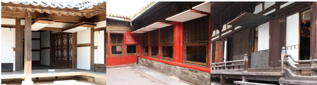
Figure 7. 들문과 들창(왼쪽부터 한국의 들문, 중국의 들창, 일본의 들창).

게 사용하여 솟아날 듯 탄력 있는 곡선과 굽이치는 자연의 격정적인 모습을 보여준다. 일본의 지붕선은 직선에 가깝다. 서까래의 배치에 있어서도 일본에서는 날카롭게 치목된 꿈은 각재들을 등 간격으로 배열하고, 귀와 추녀에서 직각으로 짜 맞추어 나가는데 비하여 한국의 서까래들은 추녀에서 선자 서까래를 사용함으로써 유연함을 이루어 일본 건축의 날카롭고 기계적인 맛과 달리 부드러운 특징을 드러낸다(Kwon, 2006), (Figure 6).