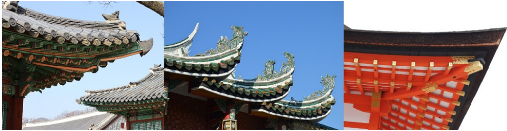
Figure 6. 지붕 처마선(왼쪽부터 한국, 중국, 일본의 지붕). From Photographed by the author. (March 12, 2017)