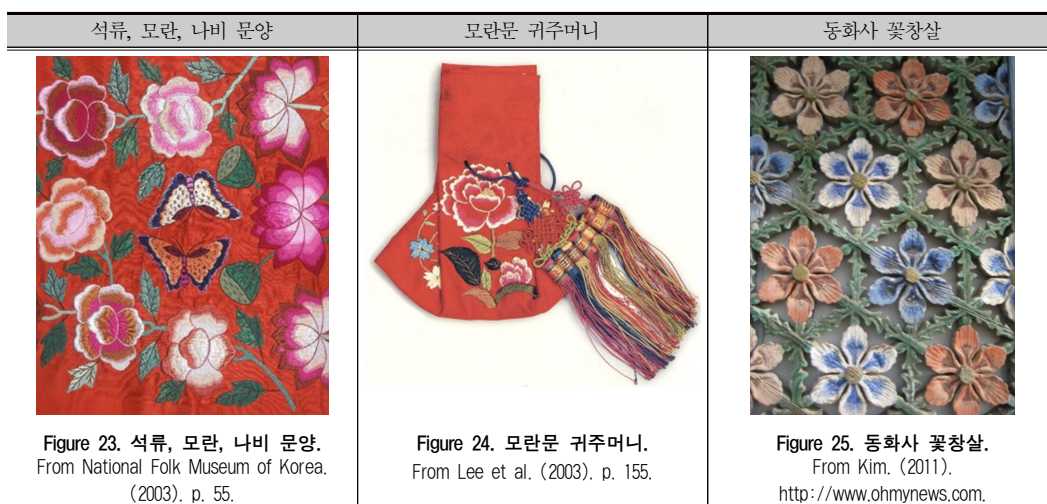
Table 10. 모란을 모티프로 한 직물과 주머니, 꽃창살.

문양과 단순화된 문양이 같이 나타난다. 다양한 염색기법이 발달한 일본은 단순한 기모노 위에 회화적인 표현으로 장식성을 더했다.