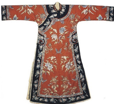
Figure 5. 청말 치파오. From Garrett. (2007). p. 51.

기모노의 원형인 고소테는 가마쿠라 시대에 내의와 외의를 겸한 서민의 옷으로 남녀공용이었다. 무로마치 후기에는 고소테를 표의로서 착용하게 되었으며 현재의 기모노에 비해 길의 폭이 넓고 발목까지의 길이에 오비도 남녀 공용으로 폭이 좁았다(Koike et al., 2000, 2002/2005). 기모노는 한국과 중국의 전통복식에 비해 더 직선적이고 평면적으로 의복을 체형에 맞게 만드는 것이 아니라 기츠케(着付け), 즉 옷매무새로 몸에 맞추어 착용하는 의복이다(Jeong, 2009). 모든 기모노는 형태가 같고 성별과 체형에 관계없이 누구나 입을 수 있도록 크기가 표준화 되어있다(Namkung, 1999). 옷을 걸어 올려 착용하는 오하쇼리(おはしり)는 표준화되어 있는 기모노를 착용자의 키에 맞춰 착용하는 것이 가능하게 하였다.