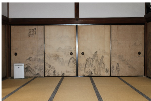
Figure 4. 후스마. From Photographed by the author. (March 12, 2017)

격성과 통일된 비례감을 갖게 하였다. 일본은 목조 건축에 적합한 좋은 재질의 목재가 많이 생산되어 모듈화에 필요한 규격화된 부재를 만들 수 있었다. 또한 모듈화는 한정된 조건을 제공하여 미적 표현을 위한 세부기법이 발달하는 이유가 되었다.