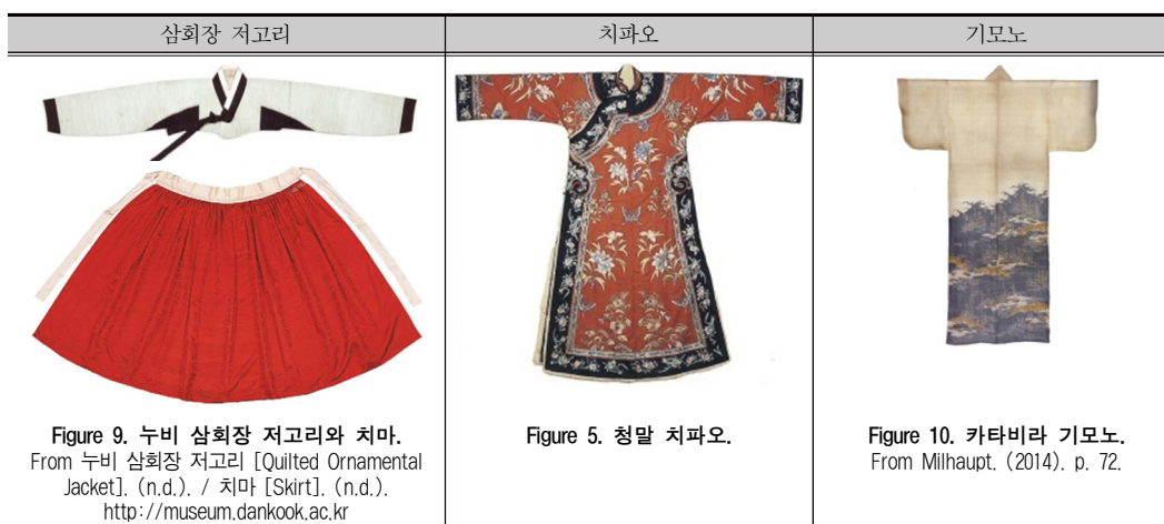
Table 3. 한·중·일 전통 복식의 선 비교.

(褌)는 어깨에 걸친다는 의미를 가지고 있다. 치파오는 인체에 의복을 밀착시키는 기마민족의 특징을 고스란히 가지고 있으면서 한족의 복식문화의 외형적인 화려함을 더했다. 때문에 기마민족의 복식에서 발전한 서양복과 유사한 형태감을 가지고 있다. 일본의 기모노는 인체의 형태와 상관없는 형태로 만들어 졌다. 기모노는 벗어서 개어놓으면 원단과 구별이 되지 않을 정도로 평면적이다. 한복은 인체의 형태에 어느 정도 맞춰져 있으며, 착용하면서 착용자의 상태와 상황에 따라 매무새를 다듬는 가변적인 의복이다.