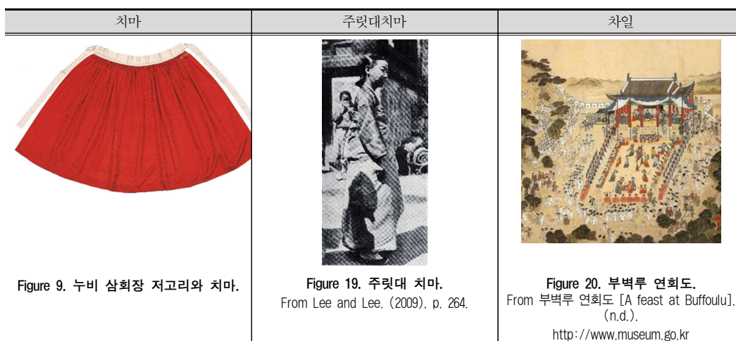
Table 8. 가변적인 치마의 착용, 건물에 부착된 차일.

철저한 위계질서를 유지한다. 일본의 주거건축은 커다란 방의 형태를 쇼지몬(しょうじもん)과 후스마(ふすま)로 공간을 나누지만 후스마를 떼어내면 공간은 하나가 된다. 중국은 담을 쌓고 담을 벗어나지 못하며 일본은 내부지향적으로 외부와 소통하지 못한다. 반면에 우리나라의 건축은 내부와 외부가 통한다.