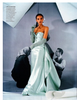
Figure 9. Vogue US May 2014. From Jsac. (2014). https://dustyburrito.blogspot.com

으며 그의 대표적 특징으로 언급되기도 한다. 선대의 패션 사진에서 오마주하는 기법은 예술 양식간의 공존에 있어 간극을 인정하고 매개하고자 하는 전략이다(Beom & Yim, 2015). 팀 워커는 자신의 패션 이미지를 구성하는 데 있어서 경의를 기반으로 한 모방적 표현을 통해 환상성을 실현하는 것을 알 수 있다.