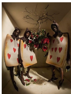
Figure 4. Alice in wonderland in Harper's Bazaar.