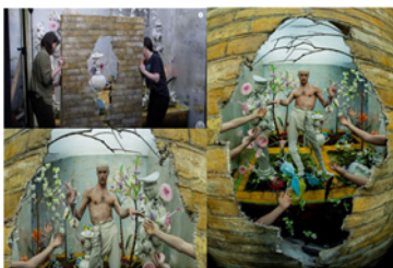
Figure 13. The Wild Dreamer: Tim Walker.