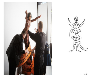
Figure 15. Tod's 'The Art of Craftsmanship'. From Tods. (n.d.). https://tods.com

석한 작업을 선보인다는 것이다. 이러한 작업을 전달함에 있어서 실재성을 더하여, 허상의 공간에 사실감을 극대화한다. 팀 위커는 시각적으로 현실에 가깝게 실현하기 위해 디지털 표현이 아닌 직접 무대 디자이너와 소통하여 세트장을 제작한다. 이러한 행위는 가상의 공간을 더 생동감 있게 전달한다.