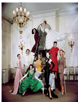
Figure 7. A New Exhibit on the Legendary Image of Christian Dior. From Cavanagh. (2014). https://www.vogue.com