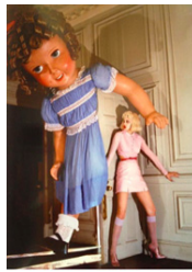
Figure 11. Like A Doll, Vogue Italia.