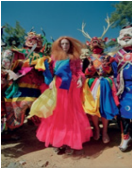
Figure 16. Karen Elson in Vogue. From Elson, (2015). https://www.vogue.co.uk