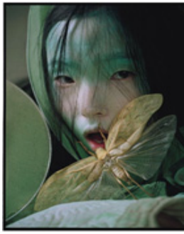
Figure 17. Xia Wen Ju in W Magazine.