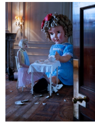
Figure 12. Like A Doll, Vogue Italia.