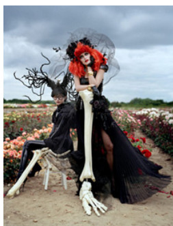
Figure 3. Tales of the unexpected in Harper's Bazaar.