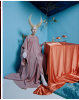
Figure 23. Tim Walker: la colorida exuberancia de la Fotografia. From Gonzalez, (2020). https://canchageneral.com

그는 자신의 작품 속에 신체를 기이하게 변형하는 작업을 즐기는데, 인체에 과한 굴곡을 주거나 인체의 뼈가 그대로 노출되는 등의 인체 해체적 표현을 통해 기괴한 이미지를 만든다. 개성 있는 외모로 할리우드(Hollywood) 대표 배우로 유명한 틸다 스윈튼(Tilda Swinton)은 팀 워커의 패션 화보에 자주 등장한다. <Figure 18>과 <Figure 19>의 경우 2005년 1월 발행된 W 매거진 속 캐서린 마틸다 스윈튼(Katherine Matilda Swinton)과 함께 촬영한 이미지이다. 입술을 기이한 모습으로 변형시킨 모습을 얼굴에 배치하거나 눈과 입을 과장하여 표현했다. 앞서 언급한 릴리 콜과 진행한 보그 화보