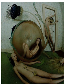
Figure 2. Garden of Earthly Delights. From "Review: Tim Walker". (2018). https://shutterhub.org.uk