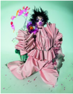
Figure 20. Björk wearing Mariou Breul.