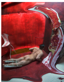
Figure 6. Homage to Francis Bacon.