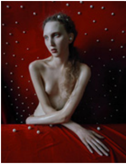
Figure 22. Tim Walker: la colorida exuberancia de la Fotografia.