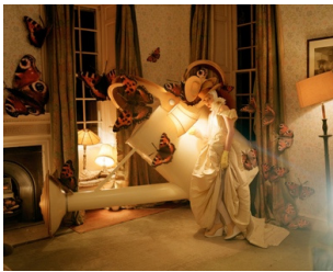
Figure 10. Imaginary Fantastic Bizarre, Vogue Italia.