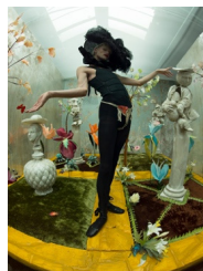
Figure 14. Box of Delights. From Malik. (n.d.). https://metalmagazine.eu