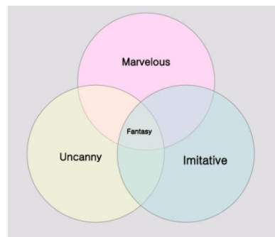
Figure 1. The type of Tim Walker's fantasy according to fantasy theory.

보그의 주력 포토그래퍼인 팀 워커가 패션계에 데뷔한 이후 일관되게 표현하는 이미지는 ‘판타지’이다. 문화적 환상성 이론을 연구한 츠베당 토도르프와 로즈메리 잭슨 등을 포함한 개념의 이해를 빌려 그의 작품을 탐색해 본 결과, 팀 워커의 작품에는 모든 작품들 속에 환상 미학의 특성들을 전반적으로 볼 수 있었다. 츠베당 토도르프를 시작으로 발전된 환상성 이론과 계승된 연구들의 세부 내용을 통해 환상성의 특징을 살펴보면, 팀 워커의 작품이 환상성이라는 미학적 원류에 대한 판단의 근거를 통해 설명할 수 있는 것을 알 수 있다. 앞서 도출한 세 가지 기능에 대한 교집합의 표출이 곧 팀 워커의 환상적 이미지의 주요 구성 요소라 할 수 있다. 팀 워커의 모든 작품 안에 환상 미학의 특성들을 전반적으로 볼 수 있다. 본 연구는 팀 워커의 작품들 속에서 환상적 이미지를 구성하는 요소들이 어떻게 사용이 되고 있는지를 구체적인 사례를 통해 살펴보았다. 최종적으로 팀 워커의 환상적 이미지를 구현하는 요소들의 용어를 환상적 경이, 환상적 괴이, 환상적 모방과 같이 정리할 수 있다. 팀 워커의 환상성의 특징은 몇 가지 주요 요소들을 중심으로 이루어져 있었다. 상세한 특징은 다음과 같다(Figure 1).