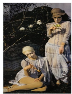
Figure 8. Fairy time in Vogue.