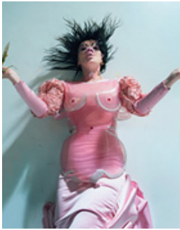
Figure 21. Tim Walker: la colorida exuberancia de la Fotografia.