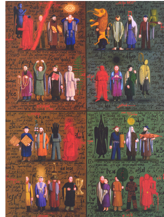
Figure 4. 그리샤 브루스킨, 『Alefbet』, 1987.

계와 외적 세계의 연결은 소비에트와 유대 전통과의 연결이다. 그는 기이하면서도 신비하게 소비에트와 유대 전통을 추상적으로 연결하였다. <Figure 4>는 하나의 화폭 안에 각각의 칸막이가 처진 방들로 구성되어 있고 사람과 초자연적 형상이 어우러져 있으며 그들의 손이나 몸, 주위에는 각종 사물들과 배경은 히브리어 경전 텍스트로 채워져 있다(Lee, 2014). 구체적으로 형상화 된 이미지들을 나열 형식으로 배열한 이 작품은 색채와 세부묘사가 풍부하고 인물들의 표정과 행동은 우스꽝스러우면서 동시에 기이함을 불러일으키는데, 람비와 촛대, 새, 물고기, 다윗의 별, 천사 등 유대 전통 사물과 토라(Torah: 율법), 카발라(Kabbalah: 구전교리)에서 얻은 주제를 나타낸 것이다(Jewish Museum, 1995). 이러한 형상들은 작가의 어린 시절 공원에 가득했던 아이러니한 형상 또는 영웅들의 조각상들과 소비에트의 기념비적 이미지들을 유대 전통의 텍스트, 기호를 포함한 형상으로 다시 표현한 것이다. 소비에트 관료제의 상징을 유대 신비주의 상징과 연결함으로써 각기 다른 두 언어가 결합하여 다른 것을 생산하는 메타 언어적 특성을 보여주는 것이다(Lee, 2014). 이러한 흐름에서 볼 때 브루스킨 역시 코마르와 멜