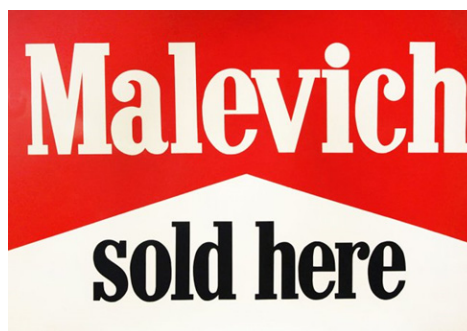
Figure 6. 알렉산더 코슬라포브, 『Malevich Sold Here』, 1989. From ALEXANDER KOSOLAPOV (RUSSIAN B. 1943), Malevich Sold. (n.d). https://www.liveauctioneers.com