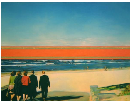
Figure 1. 에릭 블라토프 『horizon』, 1971-2. From Erik Bulatov. (2013). http://ilikethisart.net