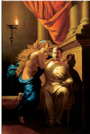
Figure 3. 코마르 & 멜라미드, 『The Origin of Socialist Realism』, 1982-83. From Soviet Nonconformist Art. (n.d). http://www.all-art.org

스탈린을 모델로 그림을 그리고 있음을 알 수 있도록 형상화하여 표현했다. 코마르와 멜라미드는 스탈린 이미지와 고전주의 양식에 등장하는 신화적인 인물을 대립하여 사회주의 이데올로기를 『The Origin of Socialist Realism』을 통해 표출하려 하였다. 이 작품은 스탈린이 장엄하게 앉아 있고 한 뮤즈가 다가와 한 손은 턱을 쓰다듬고, 다른 한 손으로는 벽에 비춰진 스탈린 형상을 붓으로 따라 그리는 장면이다. 스탈린의 얼굴에 집중적인 빛이 비추지고, 한 손에는 파이프를 들고 근엄한 모습을 사실적으로 형상화하여 표현하고 있다. 이는 아방가르드 예술의 유토피아 지향적 예술혼이 이제 정치가인 스탈린에게로 옮겨간 것이 바로 ‘사회주의 리얼리즘의 근원’임을 노골적으로 형상화한 것이다(Kwon, 1999). 이렇게 소츠 아트 예술가들은 아방가르드 예술가들을 대체하고 사회주의 리얼리즘에서 나타났던 신화의 중심인 스탈린의 현실을 재료로 하여 유토피아를 건설하려고 시도했던 인물로 형상화하여 표현하였다. 또한 이러한 형상화를 통해 하나의 회화적이면서 동시에 이중적인 의미를 지니도록 의도하였다.