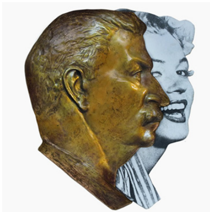
Figure 7. 레오니드 소코브, 『Two Profiles(Stalin and Marilyn)』, 1989.

소츠 아트 예술가들은 러시아인들에게 무의식으로 남아있는 스탈린의 신화를 작품에 사용함으로써 그 우상이 가진 예술적인 면과 정치적인 권력을 이용하고 있다. 그들이 보여주었던 소츠 아트는 예술가들이 정치적인 도구로 사용되었던 과거 사회주의 리얼리즘의 구조와 그 중심에 자리했