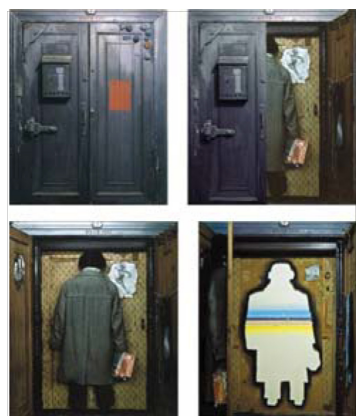
Figure 5. 블라디미르 안킬레프스키, 『Door』, 1972. From Vladimir Yankilevsky. (n.d.). http://yankilevsky.free.fr

소츠 아트의 특성인 일상과 보편의 추구는 러시아 소츠 아트 예술가들의 고립되고 자유롭지 못