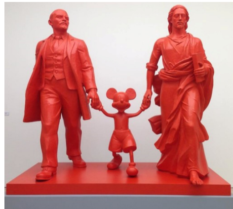
Figure 8. 알렉산더 코슬라포브, 『Hero, Leader, God.』, 2007. From ALEXANDER KOSOLAPOV. (n.d.). http://www.saatchigallery.com