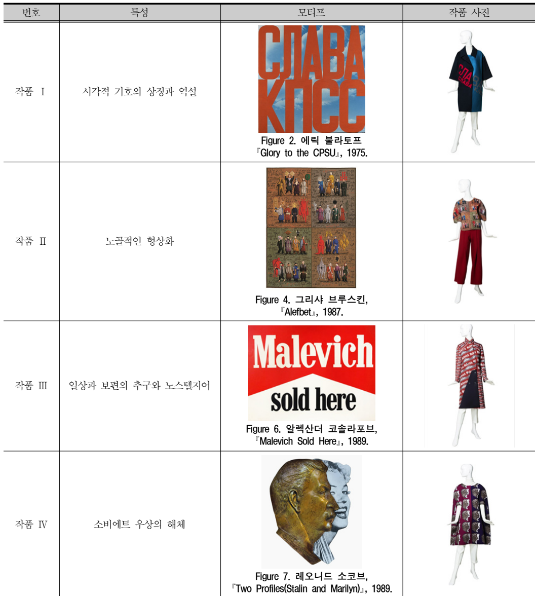
Table 1. 작품 구성표.

대표하는 레드 컬러를 슬랙스의 컬러로 설정하여 모티프 회화가 형상화하고 있는 소비에트 사회주의 이상을 강조하여 표현하였다.