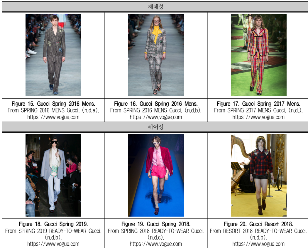
Table 4. 젠더 모호성 유형.

성 추구 시 사회의 일원으로서의 기본적 인권을 추구하지만, 동시에 법적, 그리고 도덕적인 규범에서 벗어나고자 하는 미적 표현을 추구하는 과정 속에서 구체화된다고 볼 수 있다.