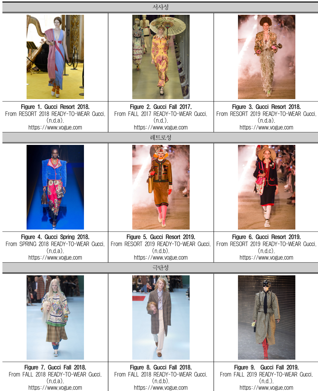
Table 2. 과장성 유형.

<Figure 1>에서는 그리스와 로마 같은 고전시대의 튜닉, 엠파이어 시대의 솔과 드레이퍼리, 르네