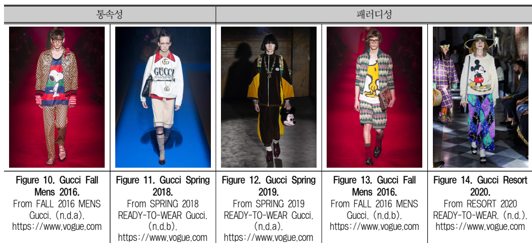
Table 3. 팝 캠프 유형.

두 번째로 나타난 패러디성의 사례에서 미켈레는 심각성과 해학성을 극적으로 긴장시켜 캠프 미학의 패러디적 감수성을 표현하였다. <Figure 12>는 글리터(glitter)와 루렉스(lurex), 그리고 타조의 깃털로 만든 작품이 주를 이루었던 2019년 S/S 컬렉션에 선보인 작품으로, 사진 속 남성이 들고 있는 미키 마우스 가방은 전체 컬렉션의 심각한 맥락과 대비되는 팝적인 요소로 작용하여, 관찰자로 하여금 해학적인 패러디성을 느끼게 하였다. <Figure 13>에는 최고급 루렉스 자카드 니트 패턴의 정교한 의상이 등장하지만, 이와 대비를 이루는 캐릭터 티셔츠와 매치시킴으로써 전통과 럭셔리에 대한 패러디를 보여주었다. 미켈레는 『Interview』와의 인터뷰를 통해, 이처럼 비맥락적인 상황에서 캐릭터들을 차용한 디자인을 등장시킨 배경을 언급한 바 있는데, 그에게 있어서 디자인 과정은 라이프 스타일과 직접적인 상관이 있다고 하였다. 그는 2019년 봄 컬렉션을 준비할 때, 부르주아적인 드레스와 재킷에 미키 마우스 모티브를 넣었는데, 그의 이러한 매치는 모든 디자인 팀원을 경악하게 만들었다(Haramis, 2018). 미켈레는 이러한 과정이 자신의 잠재적 의식 속에 기반하며, 대중들 앞에서 속옷을 벗어던지는 행위와 같은 느낌을 받는다고 하였다. 또한, 그는