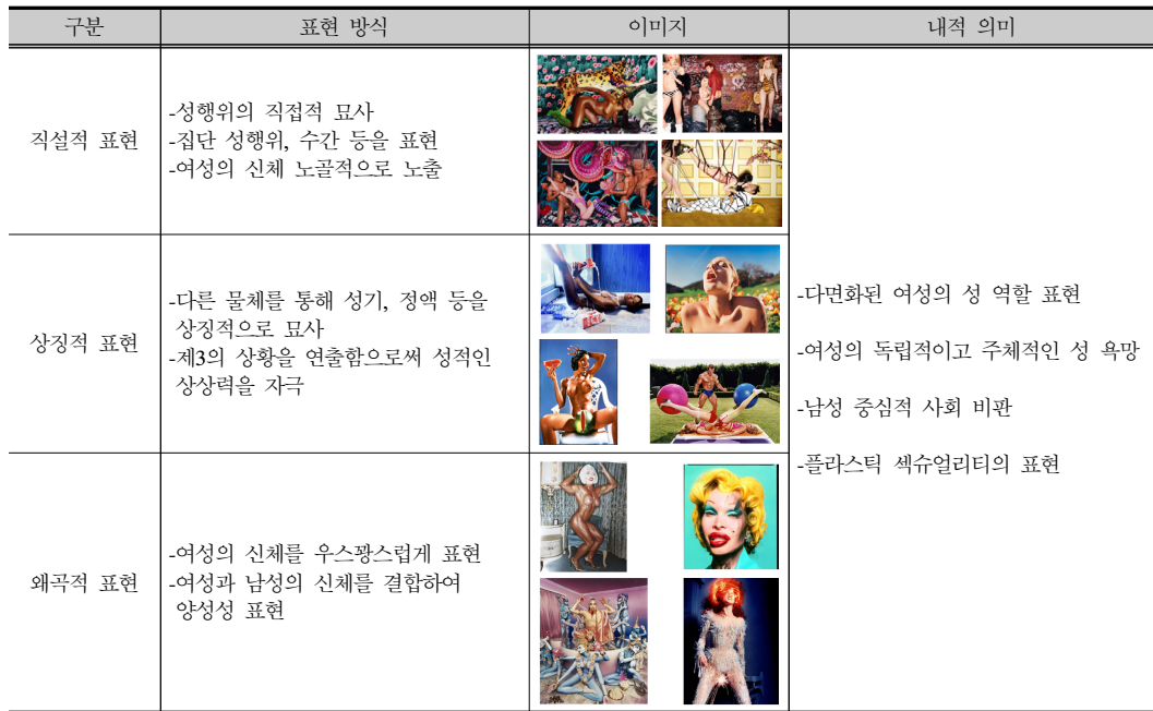
Table 3. Expression types of sexual images of women in fashion photography of David LaChapelle and their inner meanings.