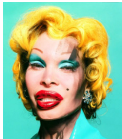
Figure 10. 『My own Marilyn, 2002』.