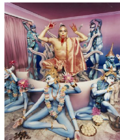
Figure 11. 『Mike Myers: Om, Hollywood, vanity fair, 1999』. From Rediff.com. (n.d.). https://www.rediff.com