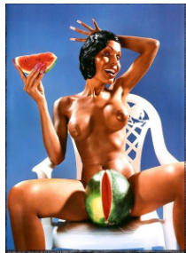
Figure 7. 『Amanda Lepore: Melon, New York, 1998』. From "Amanda Lepore". (n.d.). https://www.mutualart.com