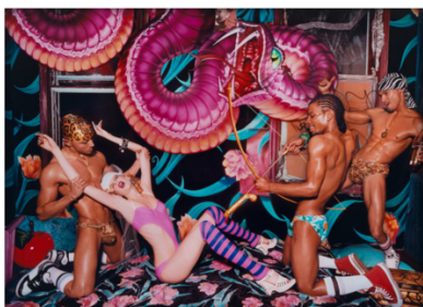
Figure 1. 『Guilty thing, 2003』. From David LaChapelle. (n.d.a). https://www.artsy.net