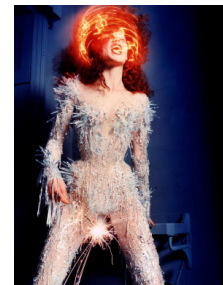
Figure 12. 『London Sunday Times, 1998』.