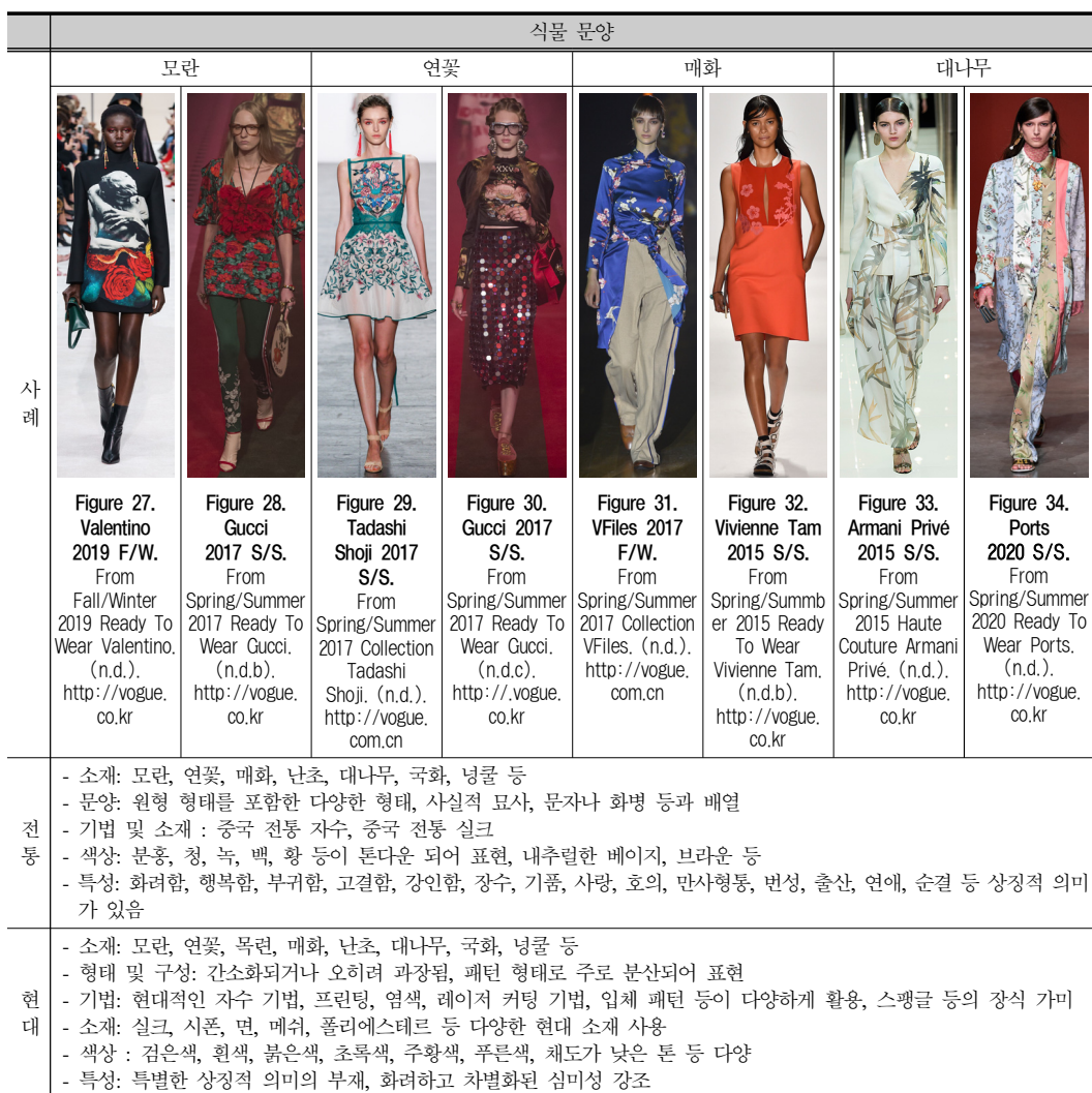
Table 2. 현대 패션의 식물 문양 적용 사례.

니 프리베의 고급스러운 이미지에 신 중국풍이 더해져 표현되었다(Figure 33). 포츠(Ports)의 2020년 S/S에 발표한 작품은 H형 실루엣으로 옅은 톤의 초록, 파랑, 흰색, 주황 조합의 긴 셔츠와 팬츠에 중국 전통 문양 매란국죽을 패턴화하였고, 청나라의 매란국죽 조합 문양은 일반적으로 둥근 형태로 사용되는 반면 현대 패션에서는 분산된 형식으로 다양한 배경의 원단에 문양이 새롭게 조합되어 신