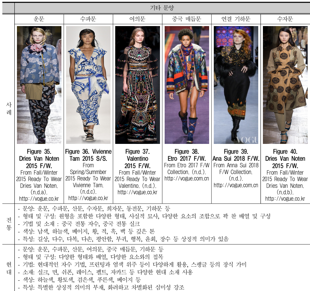
Table 3. 현대 패션의 식물 문양 적용 사례.

나타난 패턴과 유사하다. <Figure 37>은 발렌티노의 2015년 F/W에 발표된 A 라인 실루엣의 아사 원단 드레스로 검은색 바탕에 알록달록한 여의 문양과 꽃 무늬가 자수 장식되어 신비로움과 에스닉한 개성을 표현했다. 에트로(Etrot)의 디자인은 H 라인 실루엣으로 실크 소재의 박시한 반코트이다(Figure 38). 중국 매듭과 연결된 형태의 마름모-기하학 문양과 꽃 문양 자수 기법으로 현대적으로 재해석된 중국 청나라의 복식 특성을 잘 재현하였다. <Figure 39>는 안나수이(Anna Sui)의 2015년 F/W로 H 라인 실루엣을 적용한