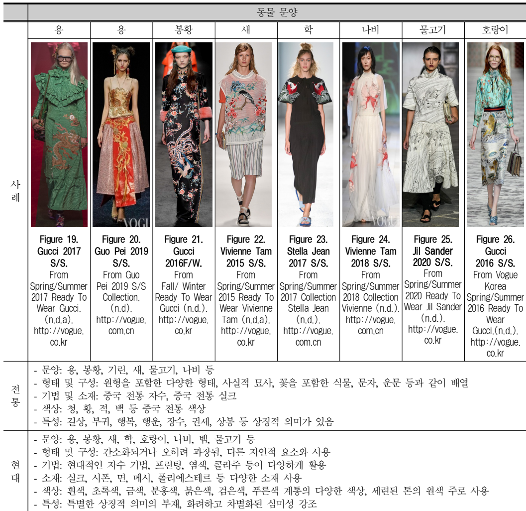
Table 1. 현대 패션의 동물 문양 적용 사례.

전통적 의미는 탈속이며, 현대 디자인에서는 화려하면서도 현대 디자인의 절제된 미를 전달한다. <Figure 30>은 구찌의 2017년 S/S에 발표한 작품으로, 검은색 바탕에 분홍색 연꽃 문양 자수 기법을 사용하며 럭셔리하고 우아함을 표현했다. <Figure 31>은 브이파일즈(VFiles)가 2017년 F/W에 발표한 디자인으로 치파오를 원형으로 하여 트임의 위치와 실루엣이 변화하였다. 푸른색 실크 원단을 바탕으로 매화와 까치 문양의 패턴 상의와 현대적이