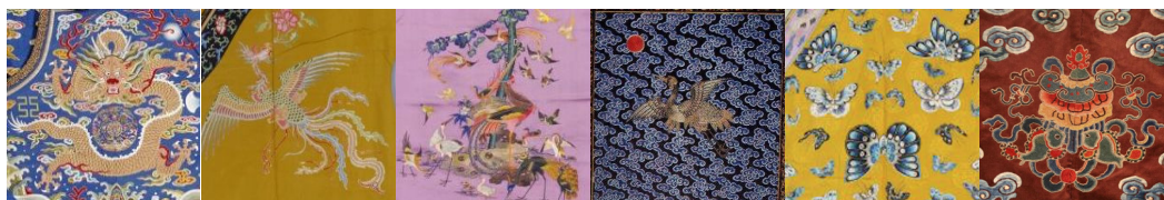
Figure 1. 용문. From The Place Museum. (n.d.a). https://www.dpm.org.cn