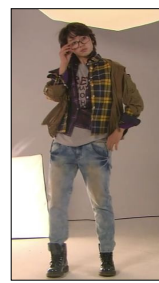
<그림 4> 『미남이시네요』, 2회