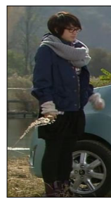
<그림 3> 『미남이시네요』, 13회