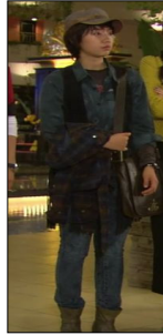
<그림 6>『미남이시네요』, 15회