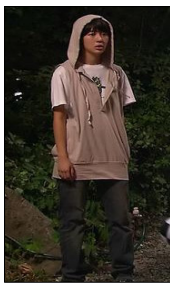
<그림 1> 『커피프린스 1호점』, 4회