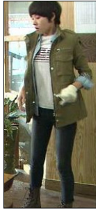
<그림 5>『넙쿨째 굴러온 당신』, 11회