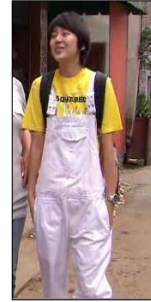
<그림 8>『커피프린스1호점』, 5회