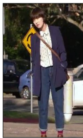
<그림 2> 『부탁해요 캡틴』, 7회